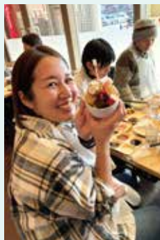
デザート てんこ盛り