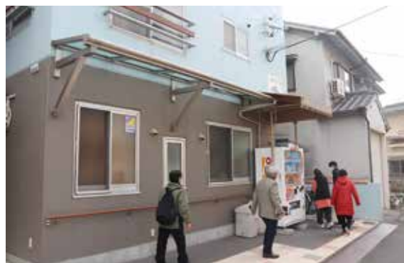
みなも・いあみの見学も行いました