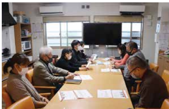
どんまいハウスの取り組みについて説明中

地域連携推進会議とは、利用者と地域との関係づくり、サービスの透明性・質の確保などを目的に入居者家族や地域住民の方に参加してもらう会のことです。どんまいハウスでは令和8年1月27日にみなもで開催し法人理念や取り組みについて話し、質疑応答の時間も設けました。