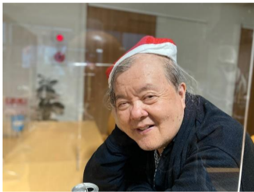
▲「さあ、何処にプレゼント配りに行こかな〜？」▲

発行所 「きょうのばんめし」 編集委員会 松山市本町6丁目11-8 どんまい本町センター TEL 089-907-3380