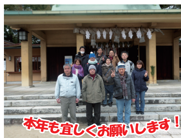
本年も宜しくお願いします！