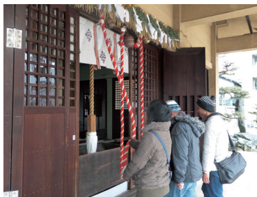
それぞれの願い事を