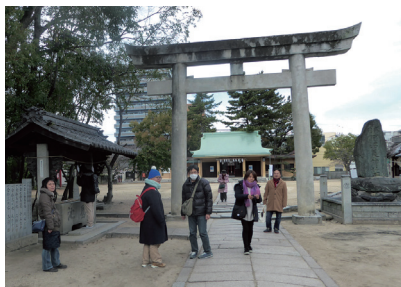
午前の作業を終え 阿沼美神社に集合