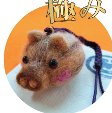
干支根付 うり坊 450 円

たくさんの利用者さんの手を介して、愛嬌ある「うり坊」が完成しました。200 ぴき近いうり坊がすでに皆様のお手元に出荷されています。ふわもこの手触り、いやされるう～。