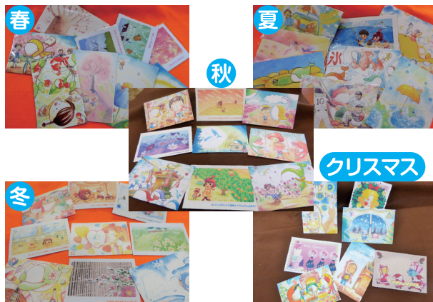
手すきエコアートはがき (しおり付) 300 円

あとりえ de まいんどのエコアートハガキは 1 枚 1 枚心をこめて手すきした紙を使用。筆やペンのノリが一味違います。数あるラインナップから春・夏・秋・冬・クリスマスの季節ごとにおしゃれな絵はがきセット（3 枚組）をご用意しました！