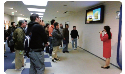
熱心に説明を聞いています