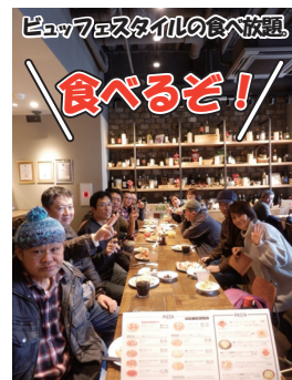
デザートまでしっかり食べて大満足!!