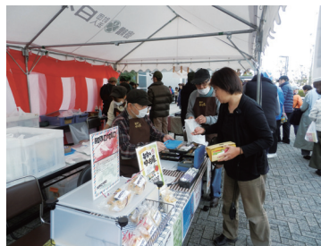
たくさんのお客様が来ていただきました。