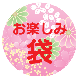
お楽しみ袋 500 円

いっぴつせんや羊毛ストラップ、メッセージカード等あとりえ de まいんどオリジナル商品が 600 円～700 円相当はあってなんとお値段は 500 円！みなさんの手に取っていただきたい商品が多すぎて、実際にはさらにサービスしまくったお得なセットです。