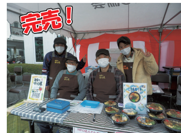
ありがとうございます♥