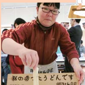
上手にうどんを作ったよ♪