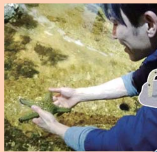
ヒトデにも触ってみました