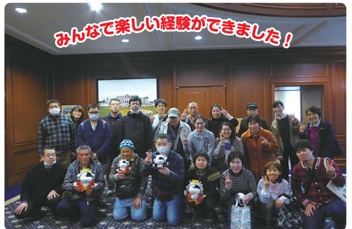
みんなで楽しい経験ができました!