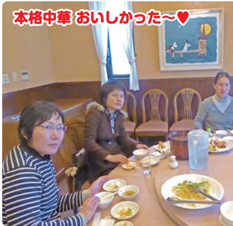
本格中華 おいしかった~♡