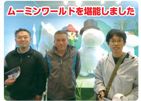
ムーミンワールドを堪能しました