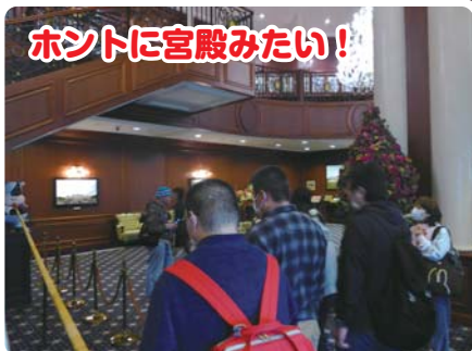
ホントに宮殿みたい!