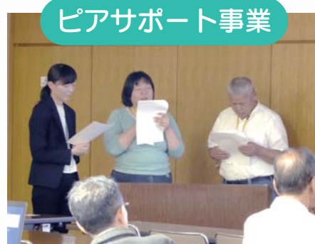
ピアサポート事業