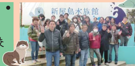
また、来年もみんなで行こうネ！