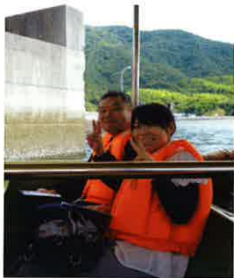
旅行好きのAさんとスタッフ

9月にどんまいハウス合同で日帰り旅行に行ってきました。毎月コツコツお金を貯め半年間かけようやく実現しました。久しぶりの遠出に行く前はためらっていた方も、旅行を通して普段味わう事のない体験や、気分転換になったようでした。次もまた行きたいという声も多く、「1泊で旅行がしたい」など前向きな声も多かったです。次も皆で計画を練って旅行に行こうと考えています。