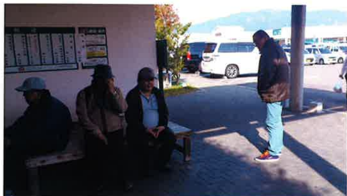
利楽温泉前で……あー気持ちよかった！